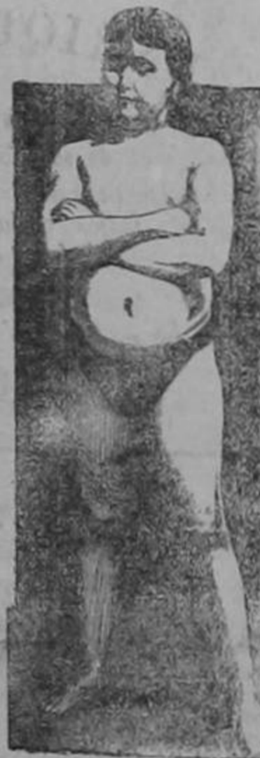
EDAD 11 AÑOS

La transformación maravillosa de un sér endeble y raquíico en un adolescente fuerte, robusto y sano, como lo demuestra su atlética figura, fué obra realizada por la